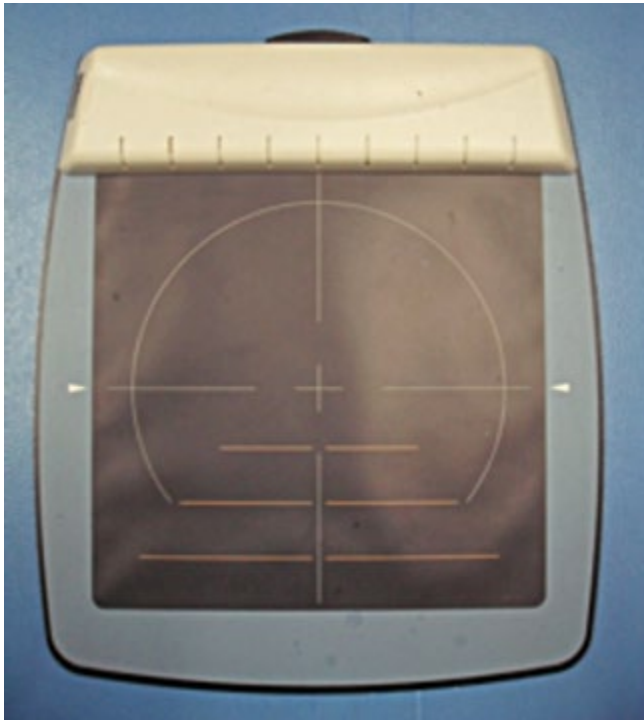
Abbildung 1: Druckmessplatte GPMultisens (GeBioM, Münster/Deutschland)

Durch eine Matrixanordnung der Sensoren ist es möglich, über hochohmige Verstärker im Interface Druckveränderungen der Sensoren zu erfassen. Das Abfragen der Signale erfolgt mit 48 Anschlüssen in Zeilen- und 48 in Spaltenlänge.