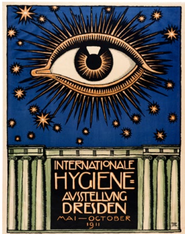
Abbildung 1: Plakat zur Internationalen Hygiene-Ausstellung in Dresden, 1911.

Deutschland wird oft als Ursprungsland der Sportmedizin mit der weltweit ältesten organisierten Sportmedizin betrachtet [3]. Die Idee zu ihrer Bildung entsprang der 1911 in Dresden durchgeführten, fast sechsmonatigen «Internationalen Hygiene-Ausstellung», die der Bevölkerung mit rund 300 Kongressen und 3000 Wissenschaftlern hygienische, d.h. «Public Health» Themen näherbrachte [4] (Abb. 1). Einer der